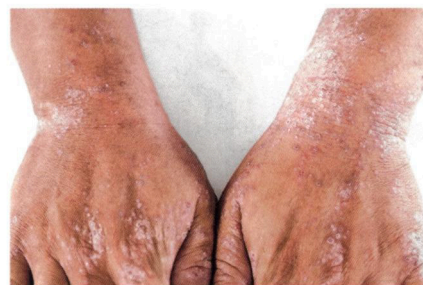
„Hauterkrankungen treten beim Kontakt mit herkömmlichen Kühlschmierstoffen häufig auf. ‚Aquaslide‘ indes ist nachweislich hautverträglich“

Wenn herkömmliche KSS eingesetzt werden, kann es zu enormen Geruchsbelastungen kommen – insbesondere nach längeren Standzeiten oder Betriebspausen, wenn sich Bakterien oder Pilze vermehren. „Aquaslide“ verhindert dies durch seine chemischen Eigenschaften. In der Praxis hat sich gezeigt, dass das Produkt während der Anwendung reinigend wirkt. Die Flüssigkeit muss daher nicht durch Kurzprogramme in der Maschine bewegt werden, sondern kann auch über einen längeren Zeitraum stillstehen, ohne dass sich Gerüche bilden. Das wirkt sich positiv auf das Raumklima am Arbeitsplatz aus. Aufgrund der wasserbasierten Formulierung bietet „Aquaslide“ bei der Maschinenhygiene einen weiteren Vorteil gegenüber herkömmlichen Emulsionen: Eingebrochene Fremdöle – beispielsweise bei der