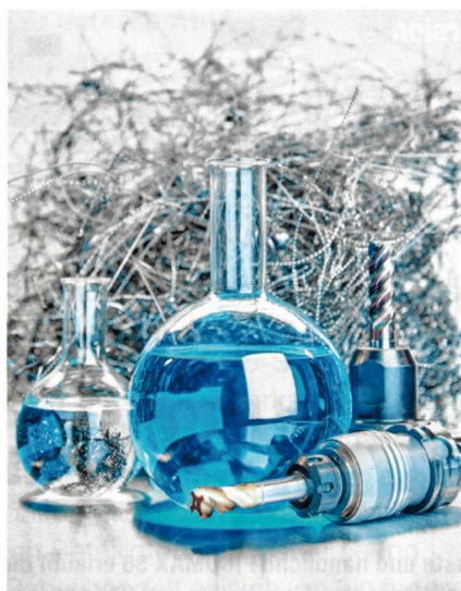
„Das bläulich eingefärbte Kühlschmiermittel ‚Aquaslide‘ eignet sich für alle Zerspanungsarten und Werkstoffe“

In der metallverarbeitenden Industrie sind Kühlschmierstoffe immens wichtig. Sie sichern die Produktivität, belasten aber auch die Gesundheit der Beschäftigten und die Umwelt und können Nachteile in puncto Anlagenhygiene haben. Der neue Kühlschmierstoff namens „Aquaslide“ ist ein öl- und esterfreier Kühlschmierstoff auf Wasserbasis und eignet sich für alle Zerspanungsarten und Materialien. In Deutschland vertreibt Coenen Neuss „Aquaslide“. Jetzt präsentiert der Technische Händler den nachhaltigen Kühlschmierstoff auf der METAV in Düsseldorf.